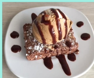
BROWNIE CLASICO CON NIEVE