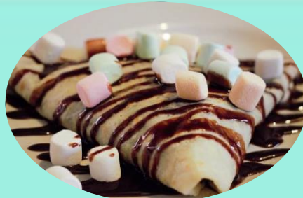
CREPA DE BOMBONES