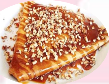
NUTELA CON PLATANO