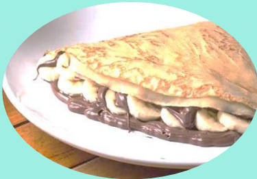
NUTELA CON PLATANO